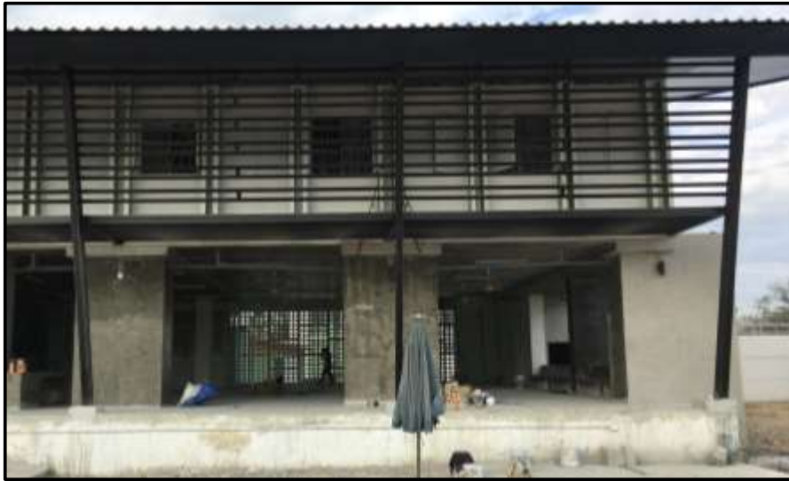
Department of Juvenile Observation and Protection Tak