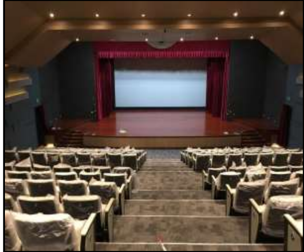
The College of Dramatic Arts Sukhothai and Department of Juvenile Observation