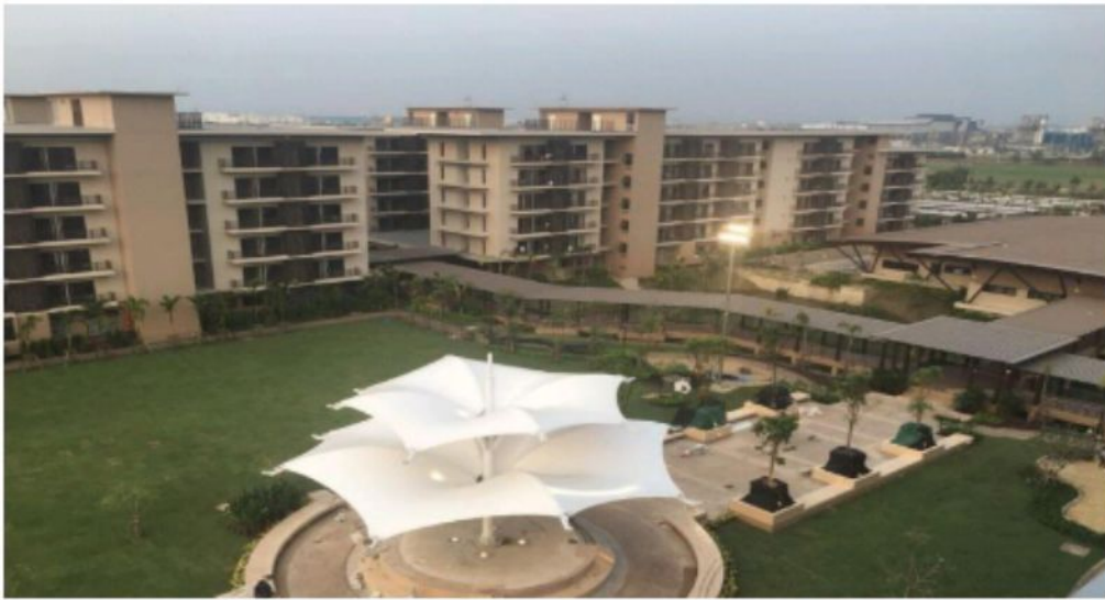
ที่พักอาศัยพนักงานโรงงานยาสูบ 6ชั้น175ห้อง2หลัง210ห้อง4หลัง โรงงาน อยุธยา