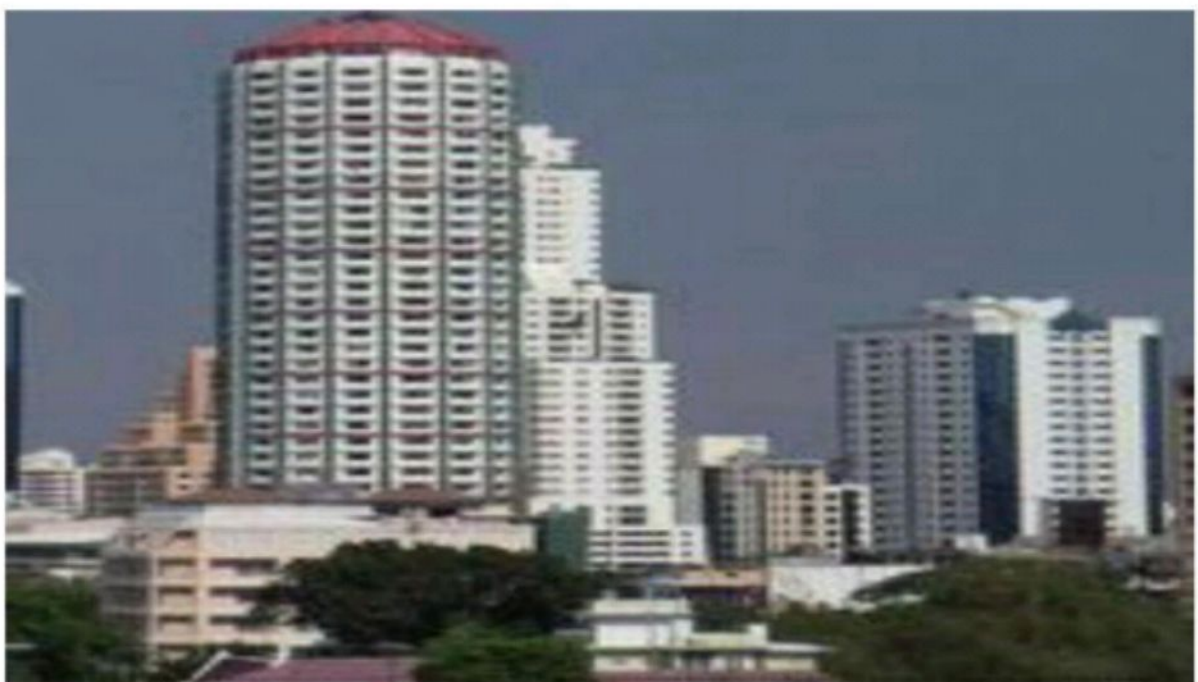
ฟิฟตีไฟฟ ทาวเวอร์ ทองหล่อ 2 วัฒนา กทม.(ปี2531-2532)