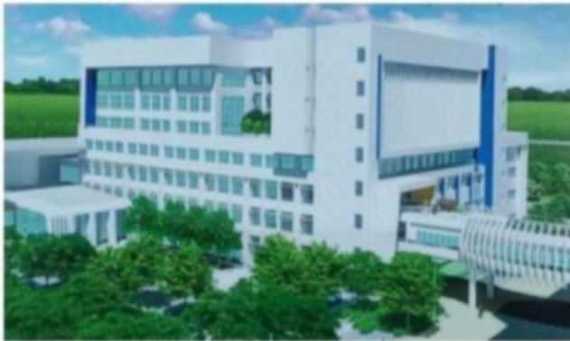
อาคารปรีคลินิกและศูนย์วิจัย รพ.รามาสุมทรรปราการ