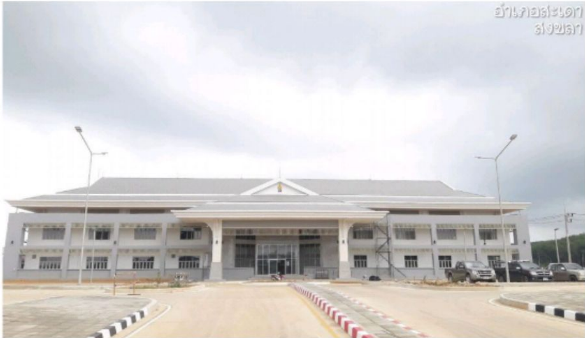
อาคาร สำนักงานด้านศุลกากร สะเดา สงขลา