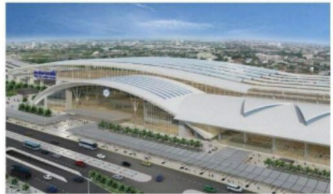
รถไฟฟ้าสายสีแดง สถานีกลางบางซื่อ กทม.