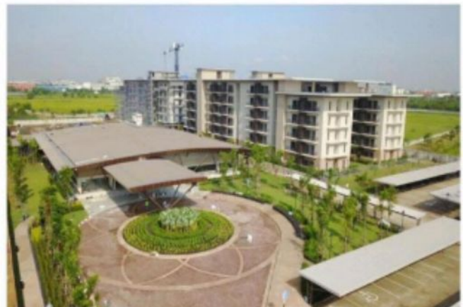
อาคารที่พักอาศัยพนักงานโรงงานยาสูบโรจนะ พระนครศรีอยุธยา