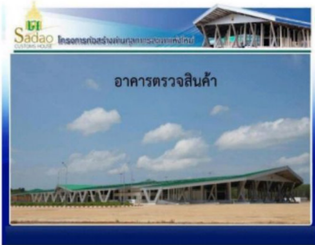
อาคารตรวจสินค้า