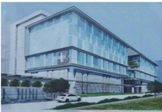
โรงพยาบาลสมองและกระดูกกรุงเทพ ช.ศูนย์วิจัยห้วยขวาง กทม.