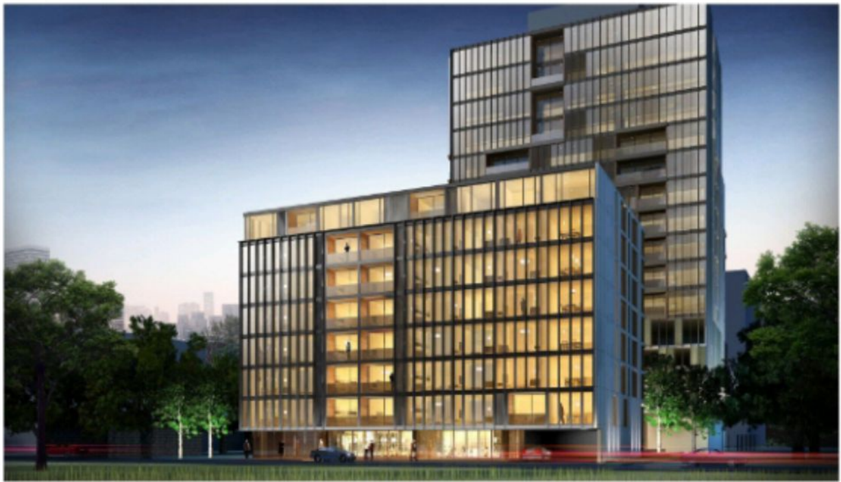
ปิยะเรสซิเดนซ์ 8ชั้นและ18ชั้น สุขุมวิท 28/30 กทม.