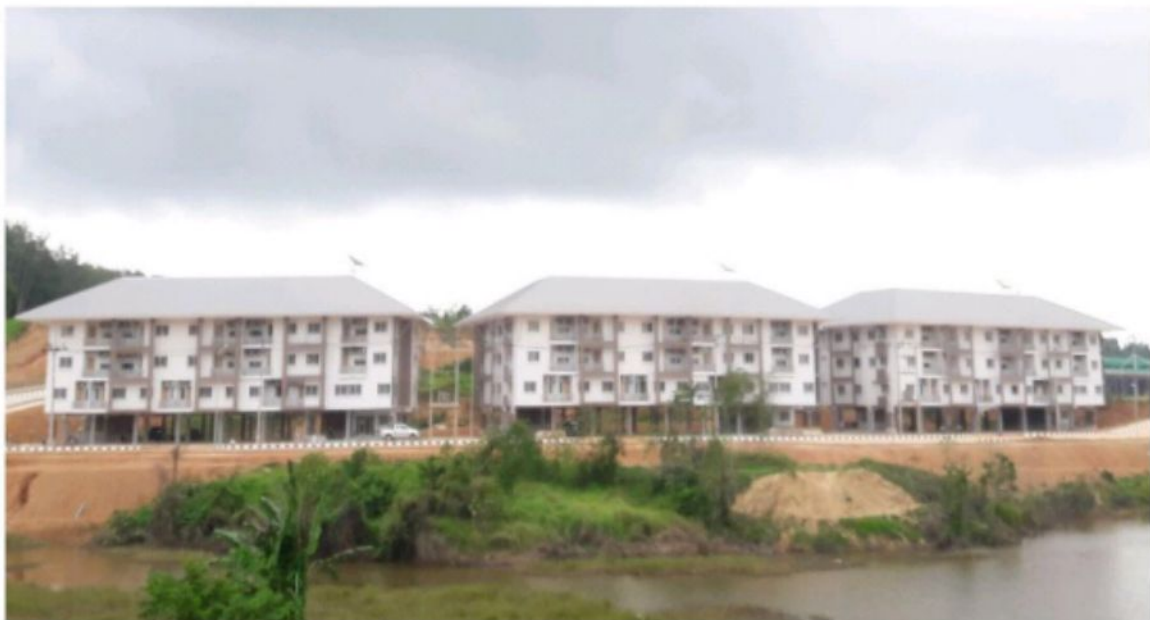
อาคาร พักอาศัย