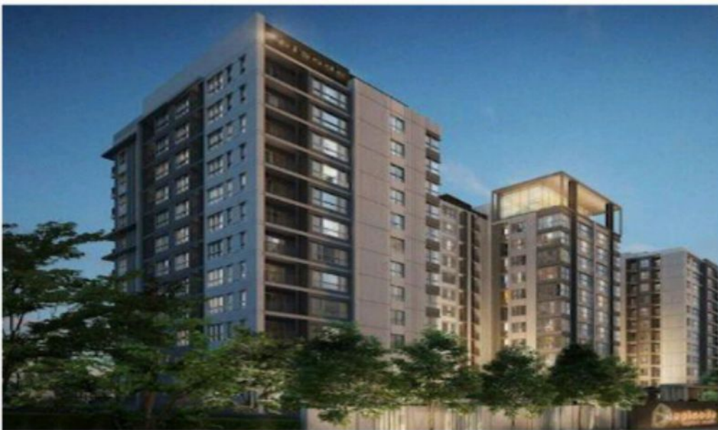
ที่พักอาศัยเอพพิไซด์ สะพานใหม่ เขตดอนเมือง สูง14 ชั้นใต้ดิน 2ชั้น 1 อาคาร จำนวน 465 ยูนิต