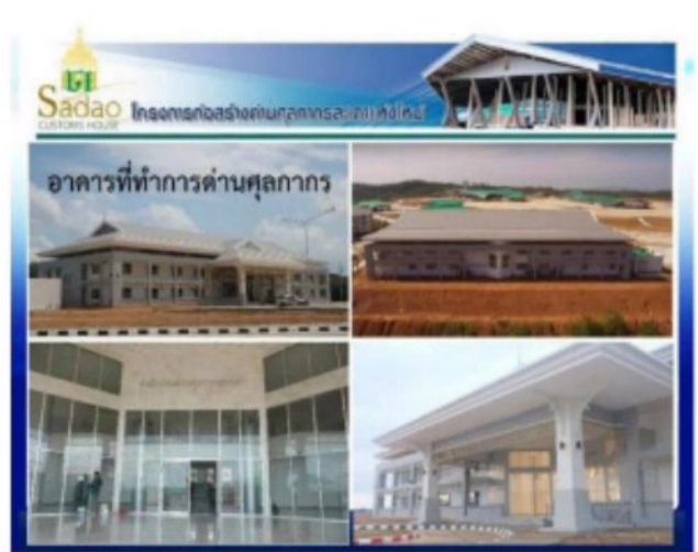
อาคารที่ทำการด้านศุลกากร