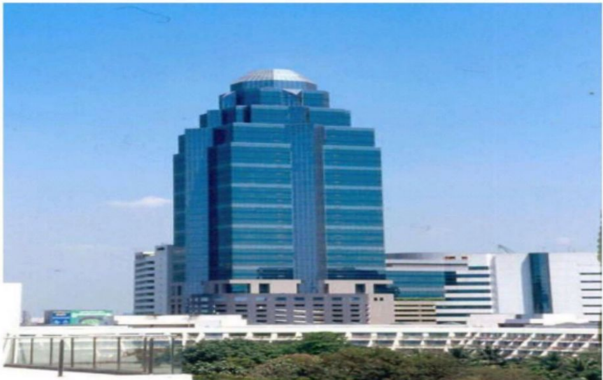
วานิช ทาวเวอร์ 2 ถนนเพชรบุรีตัดใหม่ ราชเทวี กทม.(ปี2533)