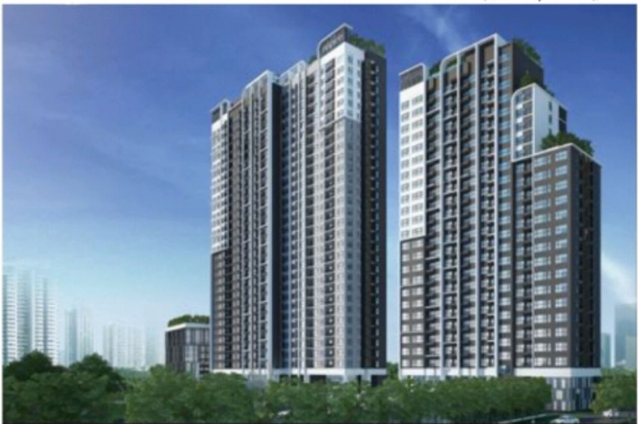
แอสสไปรร์ รัตนาธิเบศน์ 25ชั้นและ30ชั้น ถนนรัตนาธิเบศน์ นนทบุรี